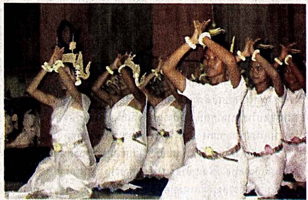
ក្រុមអ្នករបាំមកពីសាលាមូលនិធិពិសេស ដើម្បីកម្ពុជា ចូលរួមពិធី