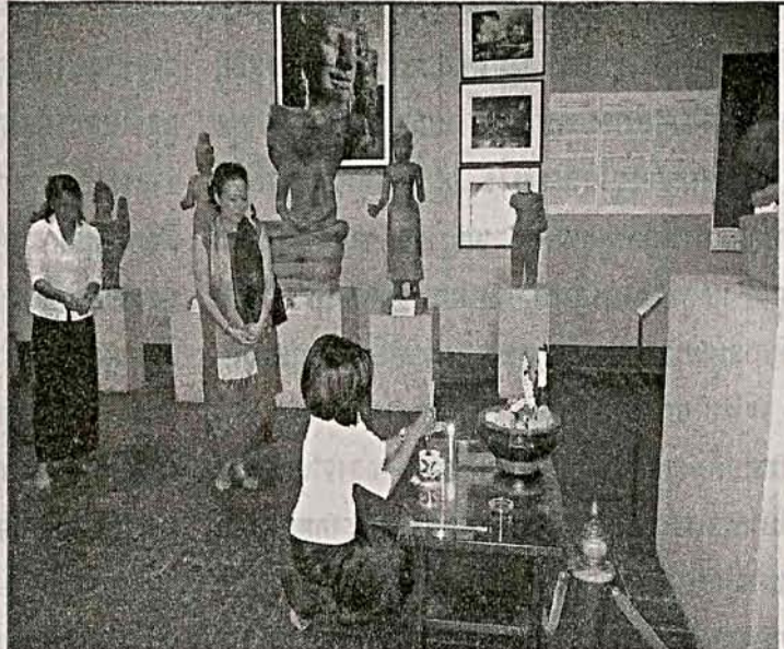
សម្តេចព្រះរាមនរោត្តមបុត្រា ទេវី អុជចូបបួងសួង ដល់វិញ្ញាណក្ខន្ធលោកចចស៍ ហ្គ្រោសលីយេ (រូបចំគ្រឿងរូប)